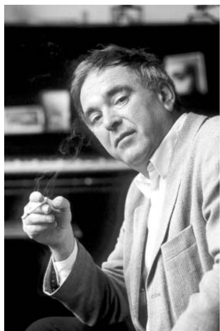
K. Schippers.

Zo is het altijd geweest bij Schippers, pseudoniem van G. Stigter, die in zijn beginjaren - hij debuteerde in 1963 - vaak in een adem genoemd werd met (J.) Bernlef. Ze gaven gezamenlijk boeken uit, schreven dezelfde soort poëzie en vormden de motor achter het avant-gardistische 'tijdschrift voor teksten' Barbarber, een blad vol dadaïstische ideeën. Aan de Barbarber-dichters zat ook een vrolijke, baldadige kant. Zo schreef Schippers ooit het gedicht 'Zoek het donderkopje tussen de komma's', een sonnet van louter komma's. Schippers, die een aantal jaren geleden is gestopt met dichten, schrijft naast zijn romans vooral beschouwingen over beeldende kunst, dans en film. Hij schreef ook twee kinderboeken die beide werden bekoord met een Zilveren Griffel. Voor de liefhebber van Schippers' werk maakt het overigens niet echt veel uit of deze nu zijn gedichten, romans, verhalen of beschouwingen leest. Bij Schippers vallen poëzie en proza immers vaak samen. Schippers heeft zijn gaandeweg ontwikkeld tot een literaire eenling die onverstoorbaar verder bouwt aan zijn oeuvre dat inmiddels 25 titels telt. Hij heeft een hekel aan de geur van heilig-