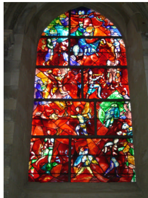
Glas-in-loodraam van Marc Chagall in de kathedraal van Chichester.

“Hoe goed is het, hoe heerlijk als broeders bijeen te wonen!”